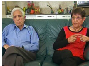
אמה של אורנה: "היה לנו מאוד קשה; התביישנו"

"אני באמת הרגשתי ממש בשלה לצאת. כמעט רקובה מרוב בשלות", היא אומרת בחיך. "הסוד הזה מהציבור ומהתקשורת, בהיותי אדם שהוא חלק מהתקשורת - לקח ממני המון אנרגיה. מהבחינה הזאת באמת יש הקלה. זה שאני יכולה לדבר על זה ולהגיד את זה בגאווה אפילו. הטיימנג היה כזה שאני אעביר את המסר באופן מאוד שלם גם לילדים שלי. היום, הם גם יודעים שאני לסבית גאה".