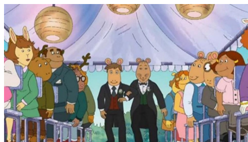
פעמוני החתונה מצלילים

באקט אופייני לתכונת הילדים, הם מחליטים לקחת את גורלם בידם - ולעצור את החתונה. אך ברגע האמת, הם מוצאים את מר עכבר פוסע בזרועות שליבות עם גבר אחר, כחתן וחתן. כיוון שמר עכבר נראה מאוהב, ארתור והחברים מחליטים לחזור בהם מהתוכנית הראשונית, ומשתתפים בחגיגות. העונה החדשה של סדרת הילדים תעלה לשידור בערוץ הילדים בקרוב.