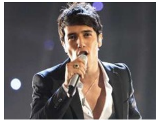
יוצא מהארון. הראל סקעת

הבוקר יהיו לא מעט אנשים שיוכלו לומר לחברים שלהם "אמרת לי", ויהיו כאלה שהלסת שלהם תישמט כלפי מטה. הזמר הראל סקעת, שהשמועות על נטיותיו המיניות התרוצצו במשך שנים, צפוי "לצאת מהארון" בסרט שישודר בערוץ 2 ולהכריז על נטיותיו ההומוסקסואליות, אחרי שנים של הסתרה.