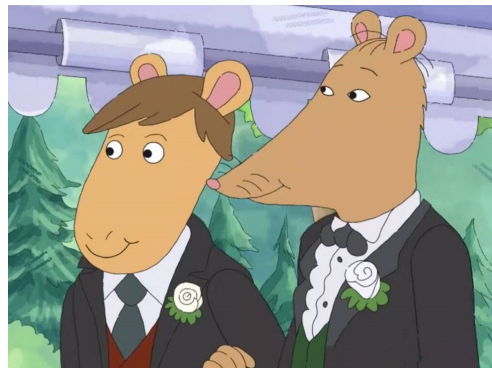
מר עכבר והחתן (רשת PBS)

כשארטור והחברים שומעים לראשונה על האירוסין, הם מבינים בתדהמה. הם עוד לא מבינים שמר עכבר עומד להינשא לגבר, אלא מופתעים מעצם העובדה שהמורה שלהם מקיים חיים פרטיים מחוץ לבית הספר - תגובה אופיינית לגמרי לילדים (בשלב מסוים בפרק, באסטר אף מרחיק לכת ואומר ש"מורים אפילו לא הולכים לישון"). בהמשך, הילדים פונשים את מר עכבר יושב לארוחת צהריים עם אחותו, ומטיקים שהיא הכלה המיועדת. הם לא מרוצים מהזיווג: האשה המסתורית נדמית להם כמישהי שעלולה לאמלל את חייו של מר עכבר, וכיוון שהם התלמידים שלו - הם אלה שישלמו את המחיר.